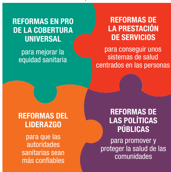
Figura 1 Reformas de la APS necesarias para reorientar los sistemas sanitarios hacia la salud para todos

El propósito de las reformas de la prestación de servicios es transformar la prestación de atención sanitaria convencional en atención primaria, optimizando la contribución de los servicios de